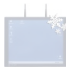
IPC-TK von -28 bis +45 °C