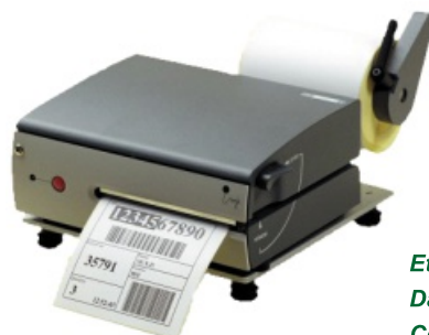
Etikettendrucker Datamax O'Neil Compact 4 mobile