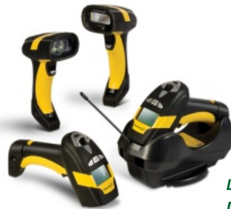
Laserhandscanner Datalogic Powerscan

Weitere Ausstattungen auf Anfrage – nehmen Sie Kontakt mit uns auf!