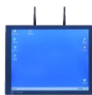
IPC Hochleistungs- Industrie-PC