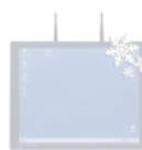
IPC-TK von -28 bis +45 °C